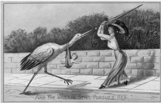
Figuur 1. Een vroeg 20 e -eeuwse briefkaart tegen de dwang tot moederschap ("And the villain still pursues her").

Al deze gevaren moesten worden uitgelegd aan de kinderen en dus kwam er behoefte aan seksuele opvoeding. Men predikte daartoe zelfbeheersing en sublimering tot aan een huwelijk. Liefst werd er echter zo min mogelijk over gepraat. In de katholieke kerk ging het toch vooral om alleen geslachtsverkeer te hebben voor het verwekken van kinderen en het staken ervan als er geen kinderen meer gewenst werden. Toch hield men zich in de praktijk maar zelden aan de voorschriften. Het rijker worden van delen van de bevolking en opkomen van het liberalisme, maakten dat mensen zich op allerlei terrein meer gingen permitteren. Daarnaast hielden mensen zich heel vaak niet aan de burgerlijke morele opvattingen (Röling, 1994, pag. 224). Rond 1900 kwam er langzaam meer aandacht voor methoden om het kindertal te beperken.