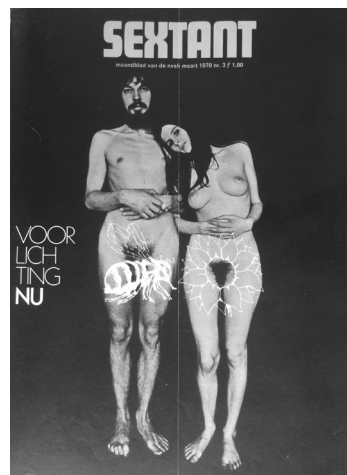
Figuur 3. Voorblad Sextant maart 1970, nr 3. (foto door auteur; met toestemming NVSH).

“Mijn vrouw heeft uitgebreid voorlichting gegeven aan onze kinderen. Toch was er in die tijd (rond 1960) nog veel onkunde en kwam mijn dochter een keer huilend thuis omdat de meisjes van haar klas haar hadden uitgescholten omdat ze had beweerd dat kinderen niet door de ooievaar werden gebracht.”